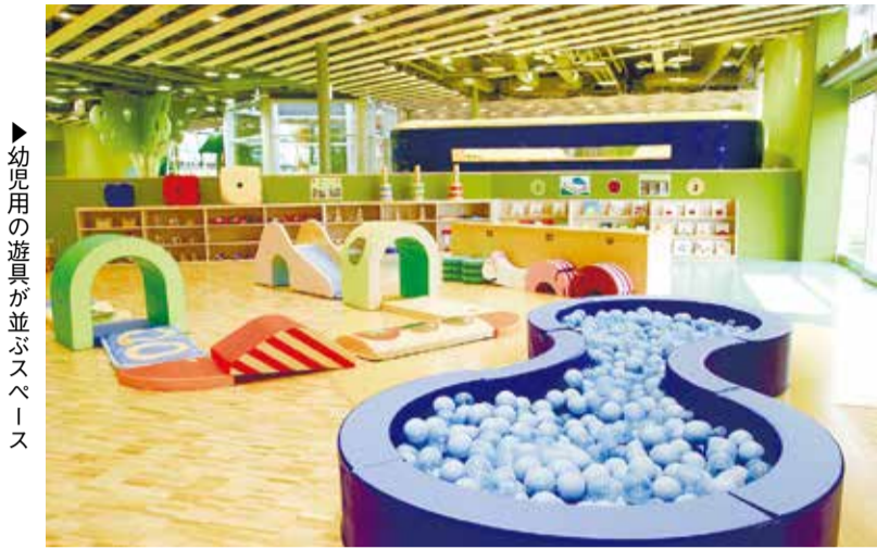
▶ 幼児用の遊具が並ぶスペース